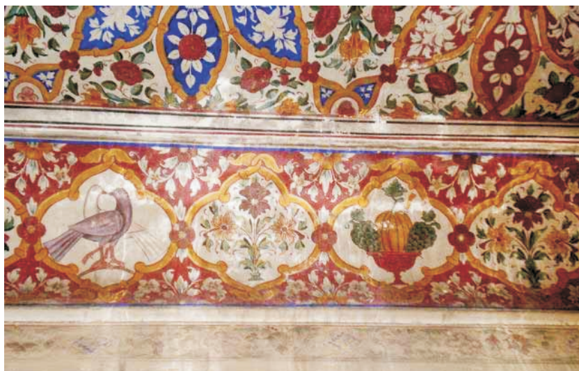
Bird forms, fruits bowls and flower vases in Surjan Singh Haveli

This method was used all over India with very little change. This is called fresco buono or true fresco. Often paintings were done on dry plaster. This is called fresco secco or dry fresco. Fresco buono or painting on wet plaster was the method used in Europe, and fresco secco mostly used in India.