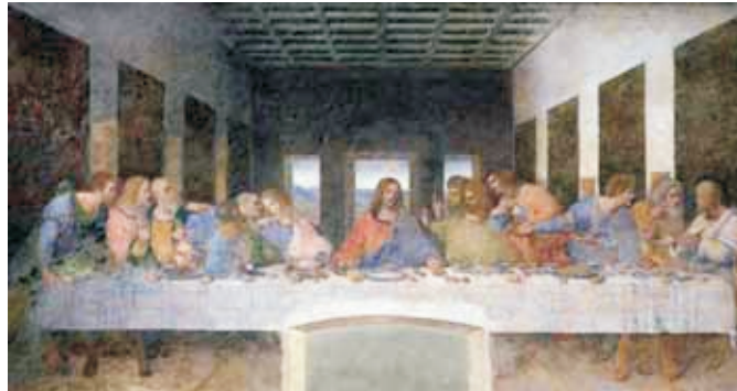
Leonardo da Vinci