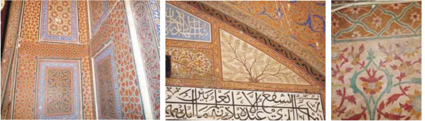
مریم زمانی مسجد

برصغیر ہندوستان میں مندروں، مسجدوں، محلوں اور ذاتی گھروں میں نقاشی کے نمونے بنائے گئے۔ ہندوستانی تاریخ کے مسلم دور بہ طور خاص مغلوں کے زمانے میں فنون لطیفہ کے تمام شعبے، یعنی موسیقی، مصوری، ادب، رقص اور تعمیرات کا فن اپنے عروج پر پہنچا۔ مغلوں کی شاہی سرپرستی اور قدر افزائی کے سبب ان فنون کو بڑھاوا ملا اور یہ پھلے پھولے۔ خوبصورت محل اور مساجد تعمیر ہوئیں۔ شاندار باغات لگائے گئے، ہندوستان کے طول و عرض اور ایران سے بھی ہنرمند بلوائے گئے اور انہیں ان تمام عمارتوں اور باغات کی نقاشی، کاشی کاری اور ٹائل موزیک کے علاوہ سنگ مرمر اور پتھر میں کندہ کاری کے کام پر مامور کیا گیا۔ جسے ہم Pietra Dura کے نام سے جانتے ہیں۔