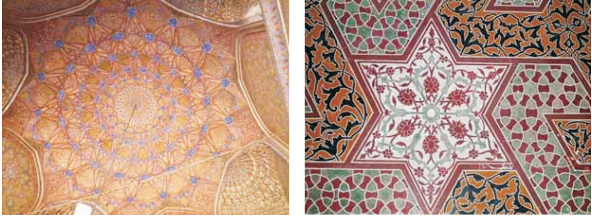
Floral and Geometric Designs in the Maryam Zamani Mosque

Throughout the history of the Indian Sub-continent, frescoes were painted in temples, mosques, palaces and private residences. In the Muslim period in India, especially in the Mughal Period all the art forms, music, painting, literature, dance and architecture were at their height. The Mughals promoted and developed the arts by giving them royal patronage and appreciation and so the arts flourished. Beautiful palaces, mosques and gardens were built and artisans from all over India and even Iran were commissioned to decorate them with frescoes (Naqqashi), tiles and tile mosaic (Kashikari) and marble and stone inlay work called Pietra dura.