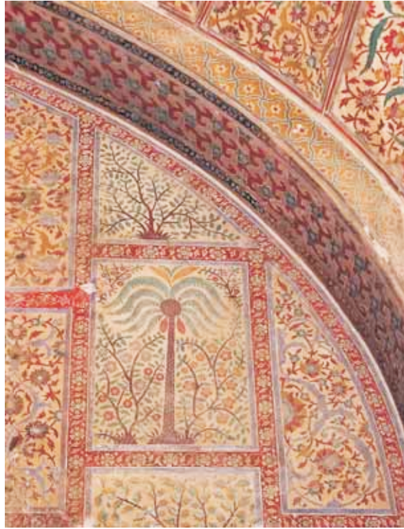
Maryam Zamani Masjid

Text: Lala Rukh Urdu translation: Zaheda Hina Drawings: Ustad Saif ur Rehman