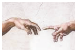
Michelangelo Sistine Chapel

In the west and in Europe there are many ancient frescoes found in palaces and temples of the ancient Greeks and Romans. Some of the most famous fresco paintings found in Europe at the time of the Renaissance are 'The Last Supper' by Leonardo Da Vinci painted on the wall of a church in Milan, Italy, and the walls and ceiling of the Sistine Chapel painted by Michelangelo in the Vatican in Rome, Italy.