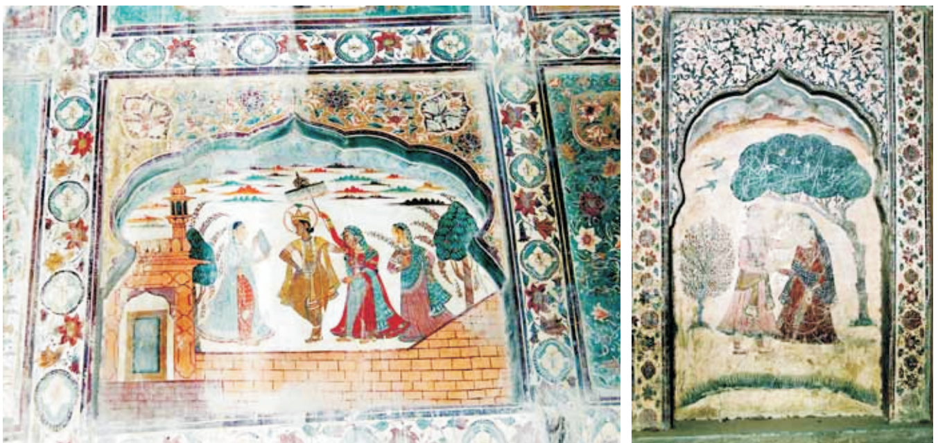
Sikh Period Frescoes in Sheikhpura Fort

This wonderful art form is in danger of dying out. Something that developed over three thousand years may be lost if we do not learn this art and pass it on to our future generations.