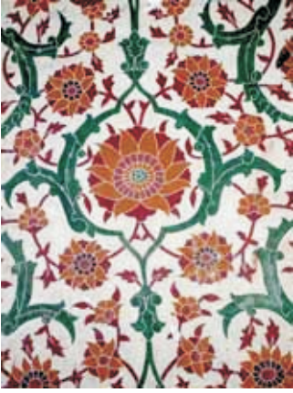
شاہی قلعہ لاہور