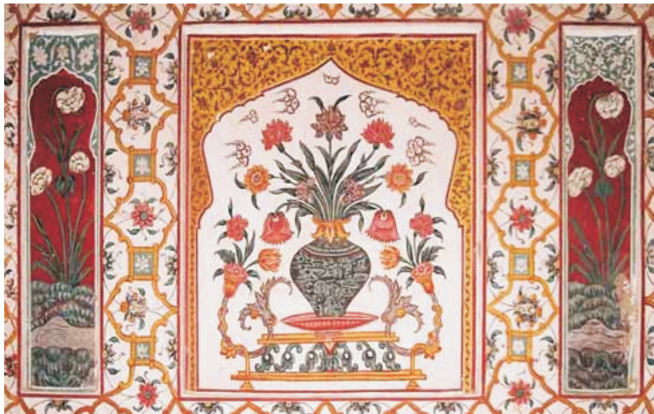
Tomb of Jehangir