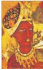
اجنتا کے غاروں میں نقاشی

برصغیر ہندوستان میں پہلی صدی قبل مسیح سے چھٹی اور ساتویں صدی بعد مسیح تک ہمیں نقاشی کے نمونے ملتے ہیں۔ ان کا تعلق بودھ زمانے سے ہے اور یہ اجنتا کے قدیم غاروں سے آج مدھیہ پردیش، ہندوستان میں بھی نظر آتے ہیں۔ نقاشی کے یہ نمونے گوتم بدھ اور ان کی تعلیمات کی تصویری کہانیاں ہیں۔ انہیں بودھ بھکشوؤں نے بنایا اور اس کے ساتھ ہی انہوں نے جاتک کہانیاں بھی مصور کیں۔