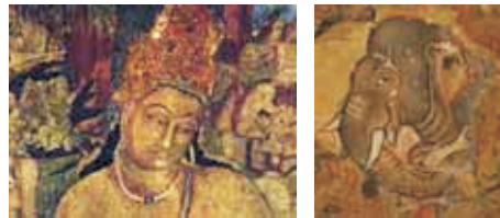
Ajanta Cave Paintings

In the Indian –Subcontinent we find frescoes that date back from the 1st Century BCE to the 6th and 7th C CE. These paintings are from the Buddhist Period in the ancient Ajanta Caves in present day Madhya Pradesh in India. They tell the story of Gautam Buddha and his teachings in pictures. These were painted by Buddhist monks who also illustrated stories from the Jataka Tales. These are Buddhist stories of moral conduct and good behaviour.